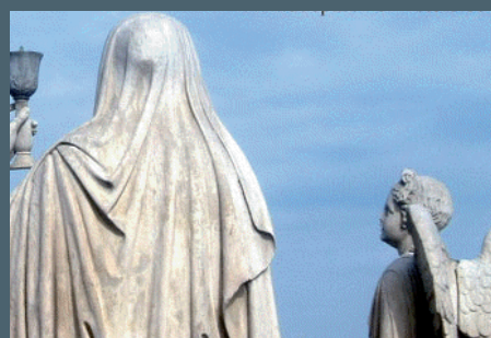
Torino tra leggende e fantasmi