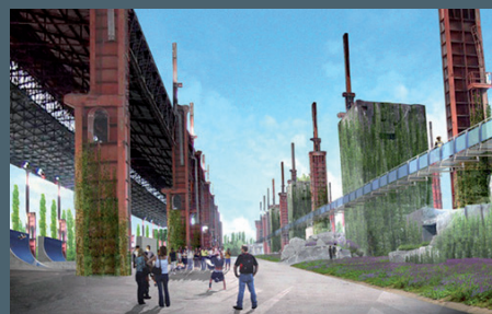
TORINO POST INDUSTRIALE